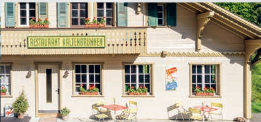
Restaurant Kaltenbrunnen Alpkäse-Toast mit buntem Salat