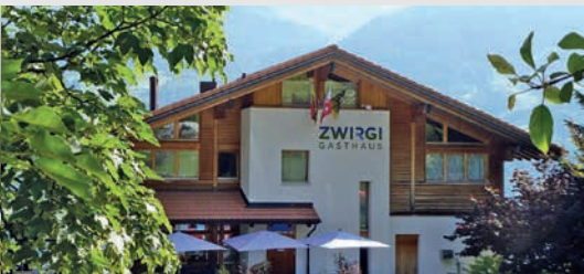
Gasthaus Zwirgi Sherlock Holmes Lunch