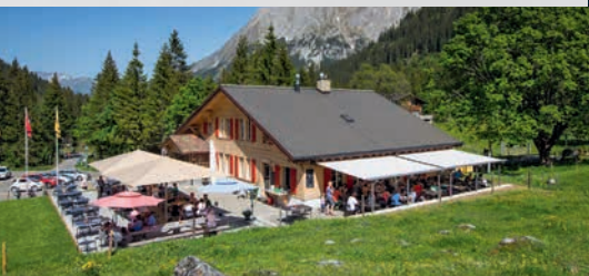
Schwarzwaldalp Tagessuppe mit Schwarzwaldalp-Käse oder Schweinswurst