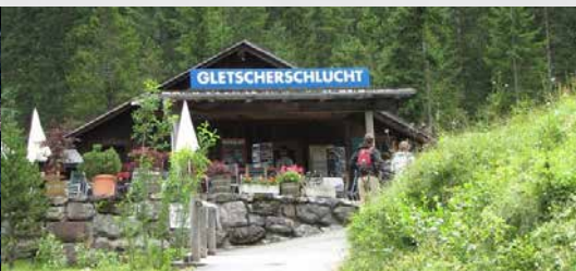
Schluchthüttli Kleine Speisekarte – Auswahl vor Ort