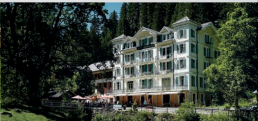
Rosenloui Pot au Feu